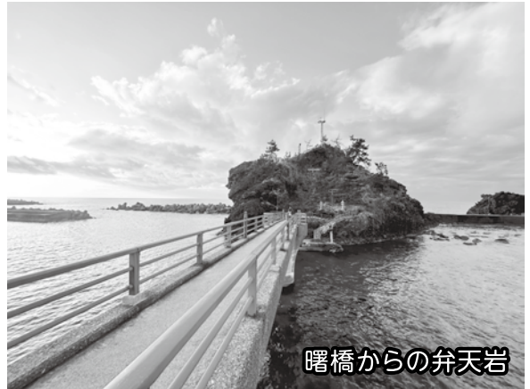
曙橋からの弁天岩

弁天岩の奇岩に生育する松の緑、 あけぼのぼし 曙橋の赤い欄干と灯台、さらに赤く染まった日本海に沈んでいく夕日…こんな弁天岩の景観がバツグンに美しいです!