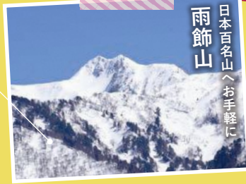
雨飾山 日本百名山へお手軽に

猫の耳と呼ばれる2つの山頂が特徴的な標高1,963mの山で、日本百名山に選ばれています。