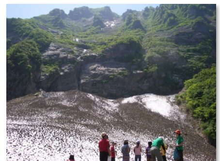
権現岳の万年雪 Permanent Snow of Mt. Gongendake