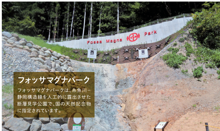
フォッサマグナパーク フォッサマグナパークは、糸魚川-静岡構造線を人工的に露出させた断層見学公園で、国の天然記念物に指定されています。