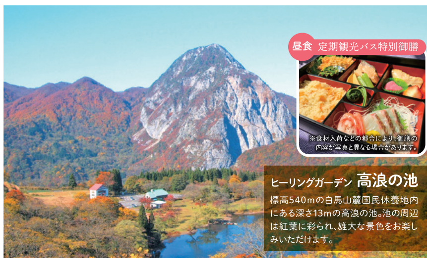
昼食 定期観光バス特別御膳 ※食材入荷などの都合により、御膳の内容が写真と異なる場合があります。