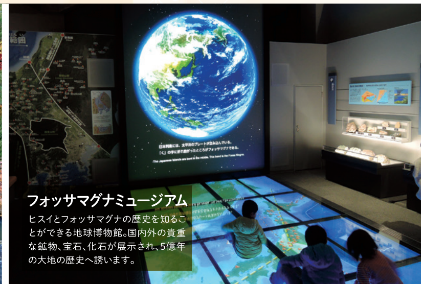
フォッサマグナミュージアム ヒスイとフォッサマグナの歴史を知ることができる地球博物館。国内外の貴重な鉱物、宝石、化石が展示され、5億年の大地の歴史へ誘います。