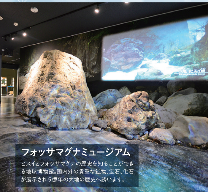
フォッサマグナミュージアム ヒスイとフォッサマグナの歴史を知ることができる地球博物館。国内外の貴重な鉱物、宝石、化石が展示され5億年の大地の歴史へ誘います。