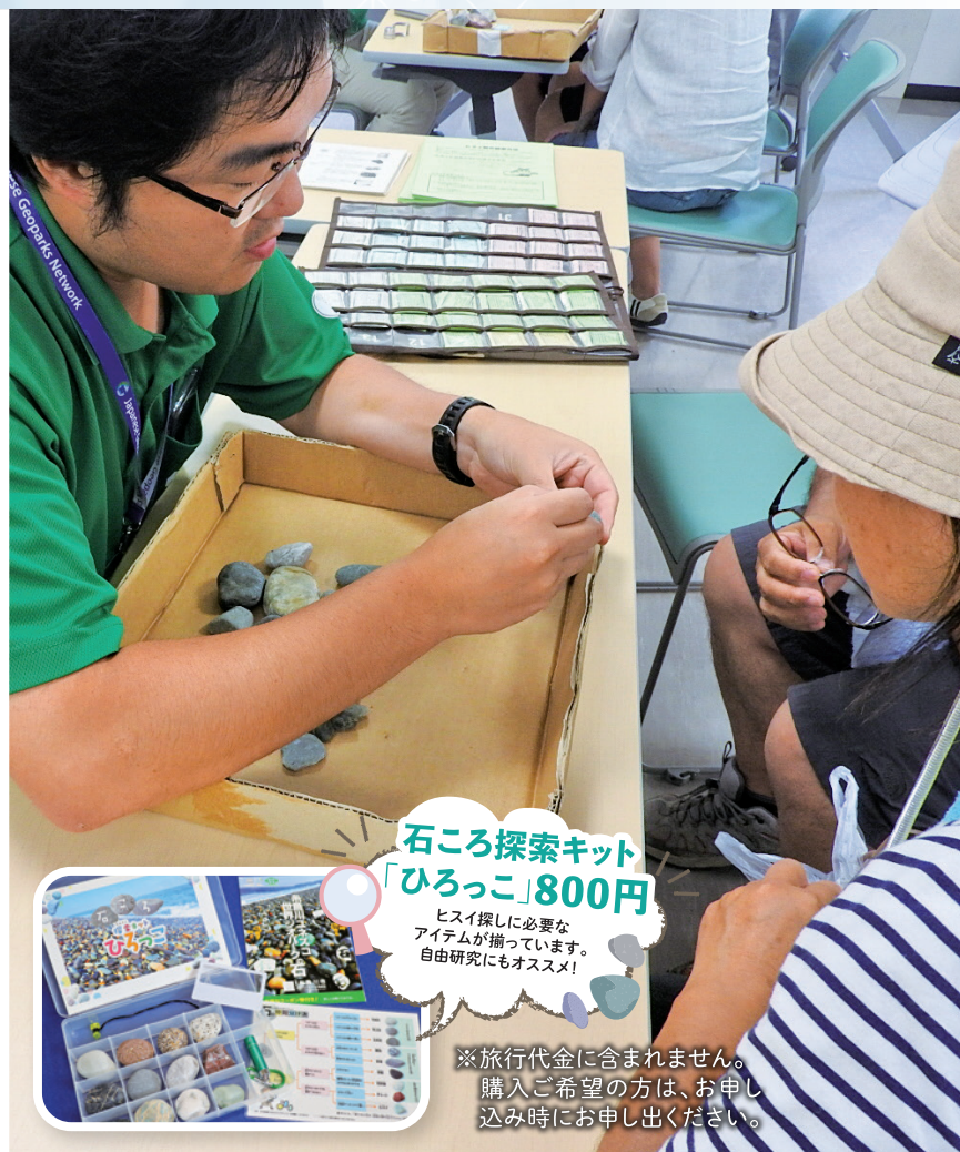
石ころ探索キット「ひろっこ」800円 ヒスイ探しに必要なアイテムが揃っています。自由研究にもオススメ! ※旅行代金に含まれません。購入ご希望の方は、お申し込み時にお申し出ください。