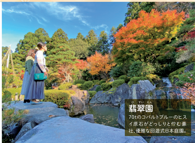
翡翠園 70tのコバルトブルーのヒスイ原石がどっしりと佇む豪壮、優雅な回遊式日本庭園。