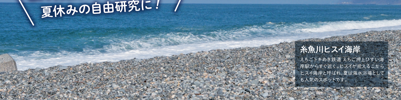
糸魚川ヒスイ海岸 えちごトキめき鉄道 えちご押上ひすい海岸駅からすぐ近く。ヒスイが拾えることからヒスイ海岸と呼ばれ、夏は海水浴場としても人気のスポットです。