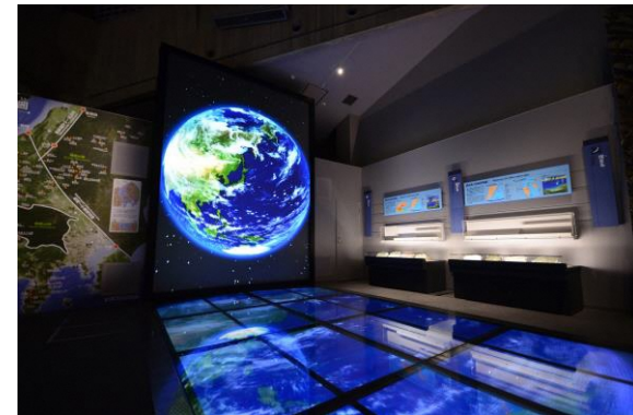
フォッサマグナミュージアム館内

※当日は、地球や日本列島の誕生をわかりやすく展示した、石の博物館「フォッサマグナミュージアム」(糸魚川市)から生配信します。