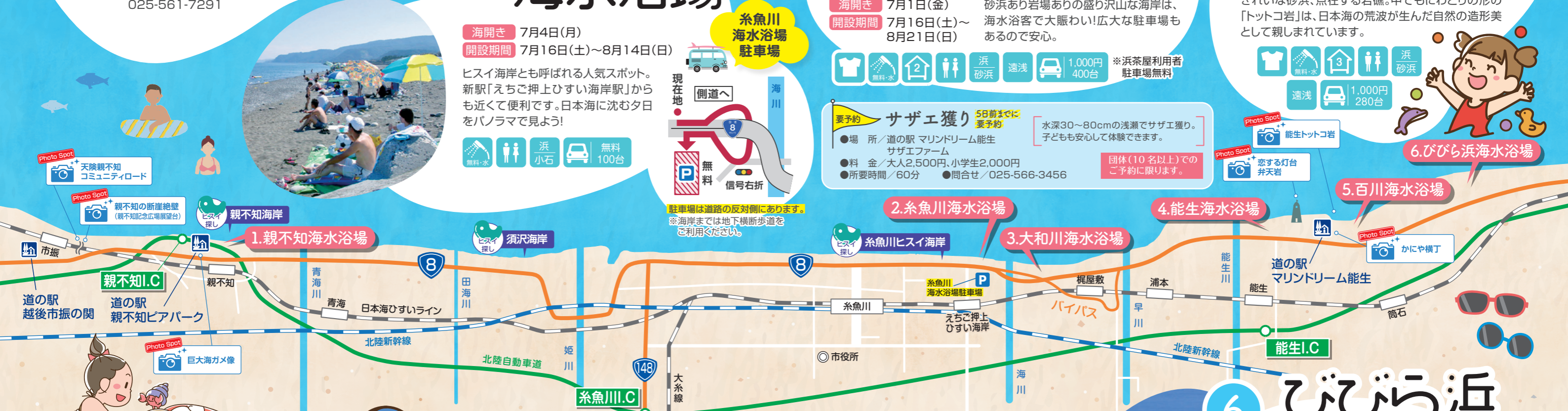
Photo Spot 能生トッコ岩 Photo Spot 恋する灯台 弁天岩 6.びびら浜海水浴場

無料・水 無料・水 無料・水 無料・水 無料・水 1,000円 280台 速浅 280台