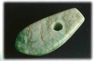
ヒスイ製大珠（長者ヶ原考古館所蔵）

最終候補となった 5 つの岩石の中から、糸魚川ゆかりの「ヒスイ」が選定されました。