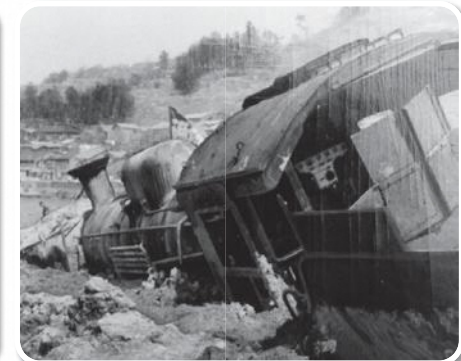
小泊地すべり(昭和38年) Kodomari Landslide(1963)