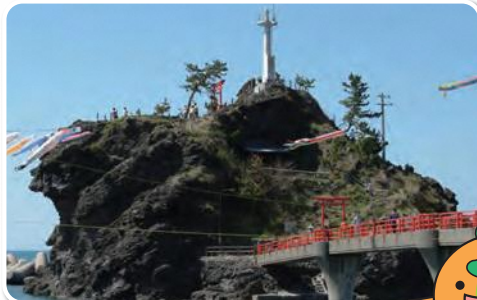
弁天岩 Benten-iwa Rock

This rock, located just off the coast, has long been worshipped as a shrine of the goddess Ichikishimahime-no-mikoto , also known as Benzaiten, a goddess of navigation and the sea. Just as Benzaiten guided sailors back to port, so does the lighthouse which stands on top of this rock. This lighthouse was designated one of Japan's Romantic Lighthouses in 2016. When exploring this rock take a close look and you can see how it is made of rugged rocks and cooled magma and hardened ash.