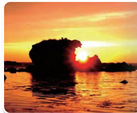
トットコ岩 Tottoko-iwa Rock

In Itoigawa's local dialect, "tottoko" means "chicken." Looking at the rock, you can see where it gets this name. The view of the summer sun as it sets behind Tottoko-iwa is one of the most beautiful sunsets in Itoigawa.