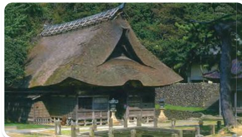
白山神社拝殿 Hakusan Shrine Worship Hall

Cradled against forested Mt. Oyama, Hakusan Shrine houses many cultural treasures, some of which are on display in the recently built treasure hall. Its forest is home to the rare himeharu cicada. The main sanctuary was built in 1515 and is remarkable for its unique, asymmetric design. The natural spring behind the shrine is safe to drink and is a popular source of drinking water.