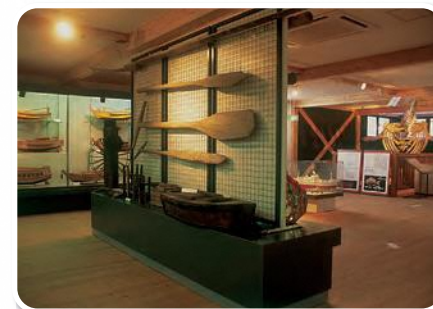
マリンミュージアム海洋 Marine Museum Kaiyo