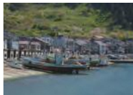
能生漁港 Nou Fishing Port

弁天岩ジオサイトの大地は、300万年前のフォッサマグナの海底にたまった砂岩・泥岩でできており、弁天岩やトコ岩、尾山は、約100万年前の火山噴出物によってできています。海の岩礁にはたくさんの魚が住みつき、よい漁場になっています。海洋文化の今昔や大地の歴史を学ぶことができるジオサイトです。