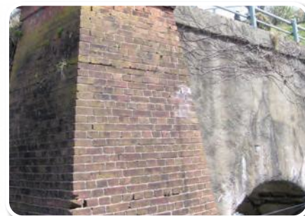
旧北陸本線のレンガ Brickwork on Former Rail Tunnel