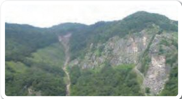
真那板山 Mt. Manaita

In addition to loss of life and property, these disasters had profound effects on local communities and the regional economy. At Himekawa Gorge, learn how the workings of our planet can directly affect our lives and communities, and what can be done to reduce risks.