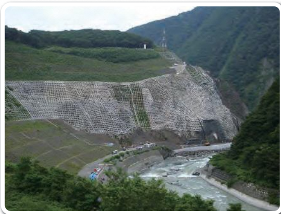
葛葉峠の治山工事 Mountain repair work at Kuzuha Pass

This mountain pass is located along the Himekawa River between the hamlet of Hiraiwa and Itoigawa's border with Nagano Prefecture. Once known as one of the most dangerous sections along the Salt Trail, it is made up of fragile rock which collapsed off of Mt. Manaita across the river. Two collapses 500 and 1,000 years ago dammed the river into a lake. As the river eroded the natural dam, it carved out the pass we see today. The pass collapsed in 1995 during the July 11 Flood and work continues to repair and reinforce the cliff.