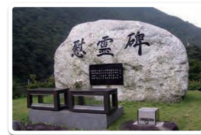
国界橋のたもとにある蒲原沢土石流災害慰霊碑 Memorial to the Gamaharazawa Debris Flow on Kokkai Bridge

The Gamaharazawa River flows along the border between Nagano and Niigata Prefectures. During the July 11 Flood of 1995, the concrete bridge which had just been finished two years before was destroyed by a debris flow-type landslide. In December 1996, as work was underway to repair the bridge, another massive debris flow occurred, destroying the bridge and taking several lives.