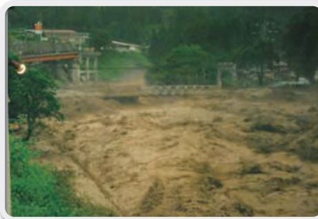
平成7年7月11日の水害の様子 Flood of July 11

The effects of this disaster can still be felt in the local communities and the local economy and population have yet to fully rebound.