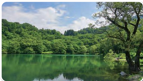
高浪の池 Takanami-no-Ike Pond

※11月中旬～4月下旬まで冬季閉鎖となります。 ※Kotakigawa Jade Gorge Geosite is closed from mid November until late April.