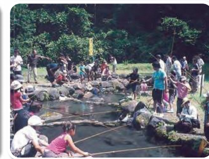
ヒスイ峡フィッシングパーク Jade Gorge Fishing Park

川の流れを引き込んだ人工の渓流で、初心者でも気軽に渓流釣りの気分が味わえます。イワナ、ニジマスが泳いでおり、釣った魚を炭火で焼いて食べることができます。