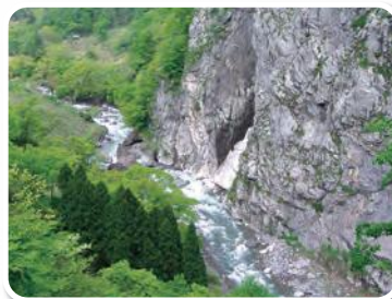
小滝川ヒスイ峡 Kotakigawa Jade Gorge