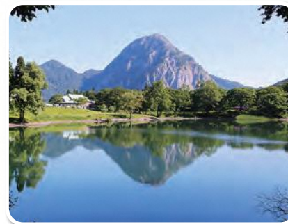
高浪の池と明星山 Mt. Myōjō & Takanami-no-Ike Pond

This 540 m high pond was formed by a landslide off nearby Mt. Akahage. Today it is a popular outdoor leisure area featuring hiking trails, a campground, restaurant, gift shop, and a small museum of the local history.