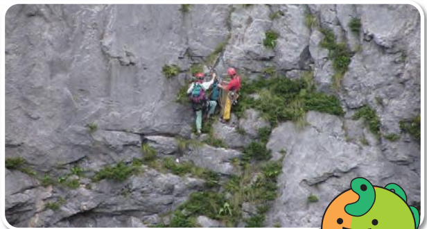
明星山の大きな岩壁を登るロッククライマー Climbers challenge Mt. Myōjō's rock face

300 million years ago, Mt. Myōjō was a tropical coral reef. Today, it is an astoundingly beautiful limestone mountain, its rugged white limestone face a popular destination for rock climbers. The southern face looms 440 m over the Jade Gorge below and is known for its fossils and the 'Itoigawa Shimpaku' juniper trees that cling to its surface.