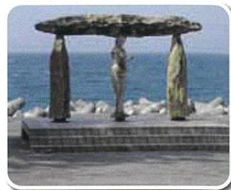
ラベンダービーチ Lavender Beach

Named for the lavender blue jade often found here, this wide pebble beach is a popular place to enjoy the Sea of Japan and discover the many stones of the Itoigawa Geopark.