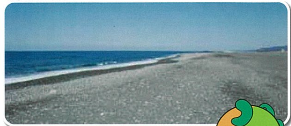
青海海岸 The Omi Coast

The Omi Coast stretches between the jade-producing Himekawa and Omi Rivers. The swift currents carry jade to the coast along with a staggering variety of stones of all shapes, colors and sizes. Naturally polished by the river currents and waves, these stones make the Omi Coast a perfect place to study the many stones of the Itoigawa Geopark.