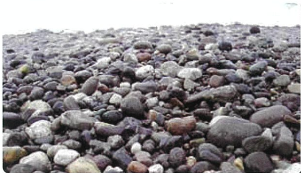
石の種類は日本一(かも!?) The Largest Variety of Stones in Japan (Maybe!?)

須沢臨海公園やラベンダービーチなど海辺でくつろぎ遊べる施設も充実し、多くの人で賑わっています。