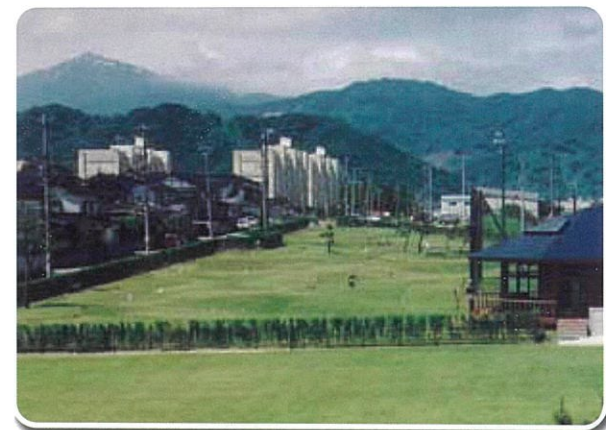
須沢臨海公園・青海シーサイドパーク Suzawa Seaside Park and Omi Seaside Park

In addition to its value as a Geosite, the Omi Coast is also a popular leisure destination. The Suzawa Seaside Park features putter golf, playground facilities and a skate park. Visitors to the Omi Seaside Park can enjoy camping, barbecue facilities and more. Shops and restaurants located conveniently nearby make it a perfect place to relax with the entire family!