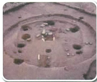
発掘された住居跡(寺地遺跡) Excavated Pit Dwelling