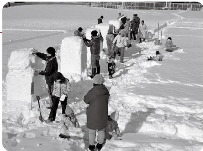
ウィンターフェスティバル

自分たちの地域を知り、体験して、楽しむ。みんなが元気になる取組もジオパークでは大切なんだ!