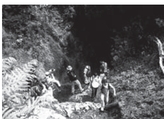
白蓮洞と高山植物

環境保護のため入山は制限されていますが、年10回程度行われるマイコミ平ツアーが大人気です。足に自信のある方、ぜひ、参加ください。