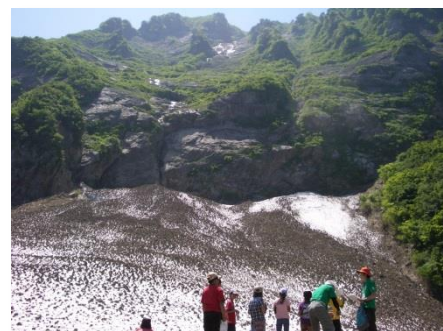
権現岳の万年雪 Permanent Snow of Mt. Gongendake