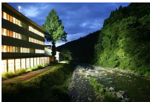
柵口温泉 Maseguchi Hot Spring