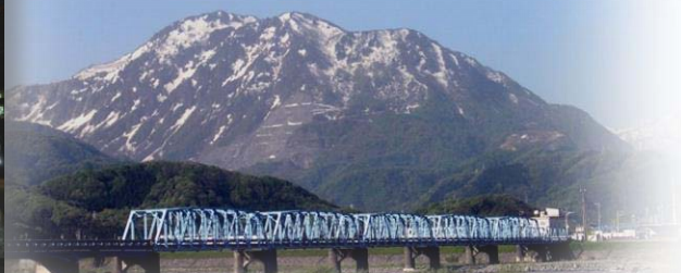
黒姫山 Mt. Kurohimeyama

The entire deposit was declared a National Natural Monument in 1957 and in addition to jade, boulders of serpentinite and other minerals can be found here.