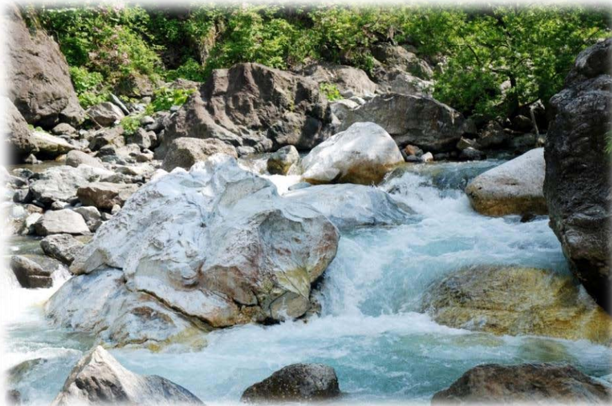
青海川ヒスイ峡(青海川の硬石産地)

Omigawa Jade Gorge (Omigawa River Jade Deposit)