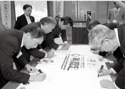
再認定を祝い、メッセージボードに喜びの声を書きました。

再認定とともにユネスコから次のことを指摘されました。改善に向け、市民の皆様のご理解とご協力をお願いします。