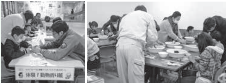
←フォーラム会場やジオパルでは、勾玉づくりやキーホルダー作りなどたくさん体験イベントを楽しめました。