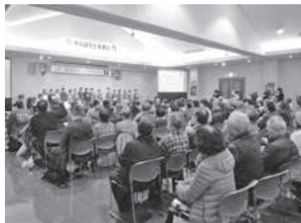
フォーラム会場の様子