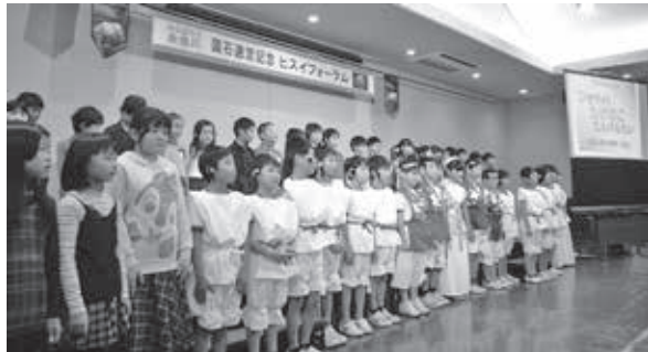
「ジオサイトだけのこたんけんたい」を披露してくれた糸魚川東小中学校3年生の皆さん。ヒスイを学び、楽しんだ成果を、ヒスイの魅力とともに伝えてくれました。

私達の子孫までもが、ずっとヒスイを楽しみ、糸魚川の誇りとしていけるよう、限りある資源として活用する方法を考えなければいけません。