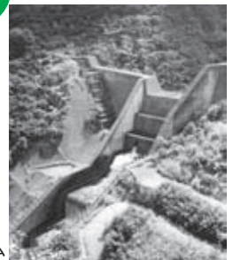
火打山川の砂防ダム

ここでいう 大噴火 とは マグマ噴火のこと。 溶岩流（地下のマグマが地上に出たもの）や火砕流が発生します。