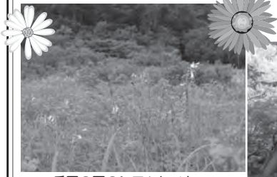
兵馬の平のシモツケソウ