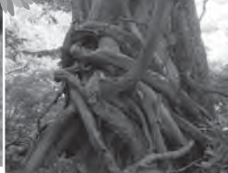
樹齢不明のネズコの巨木はなにをおいても一見の価値あり。