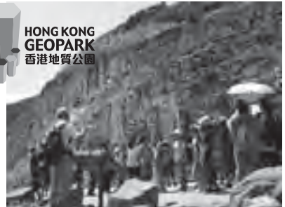
※昨年度の現地学習の様子

全3回の事前学習会を終了後、4泊5日の日程で、異文化交流、香港ジオパークの見学学習を行います。