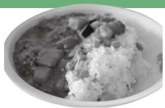
ひすいご飯と ジオカレー

ジオ給食では… 糸魚川でとれた食材を使います。 お魚、お肉、野菜、キノコ、海藻などを取り入れた献立です。 郷土料理もジオ給食 おぼろ汁、つみれ汁、 こくしょなども糸魚川の大切な料理です。