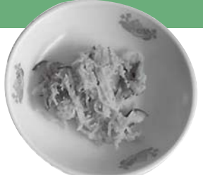
糸うりのごま酢あえ