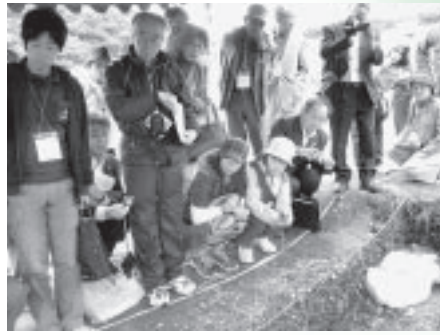
有珠山噴火の遺構を見学しました。