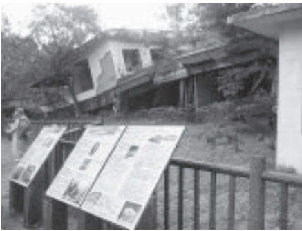
10月1日は3つのコースに分かれてジオツアーを実施。