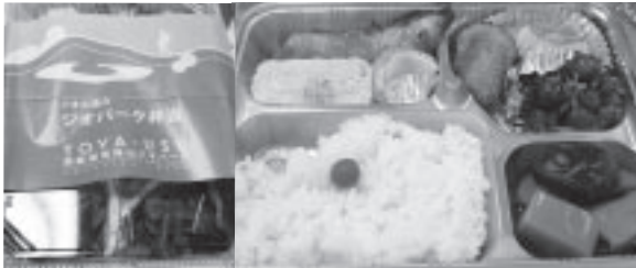
大会のお昼に出された、「ジオの恵みジオパーク弁当」。地元食材が使われています。