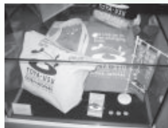
道の駅そうべつには、ジオパークポロシャツやTシャツ、バッグが売っていましたが、ガイドブックを販売しているコンビニエンスストアもありました。