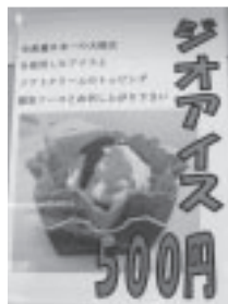
大福豆のアイスに溶岩ソースのトッピングがかかったジオアイス。有珠山の溶岩ドームみたい!?