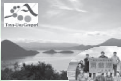
洞爺湖有珠山ジオパーク