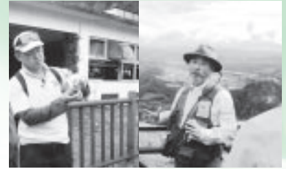
ジオツアーで活躍していたのは、現地審査と面接審査を合格・認定された「洞爺湖有珠火山マイスター」のみなさんです。