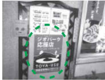
大会期間中、「ジオパーク応援店」ではジオパーク参加者特典として、飲み物のサービスや割引を受けることができました。