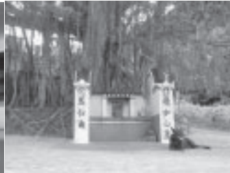
ライ・チー・ウー村の広場の大木と神様