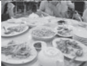
食事はどれもおいしかったです。