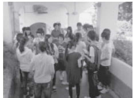
初対面ではなかなか話じづらいので、お互いの名前を覚えるゲームをして緊張をほぐします。

3回の事前学習会で作り上げた発表資料で、糸魚川ジオパークの紹介をしました。香港の生徒は大変興味を持って聞いていました。