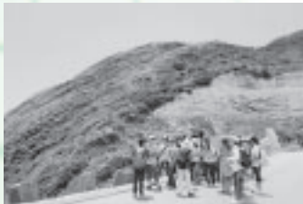
ここでは香港ジオパークのシンボルの柱状節理を見学。