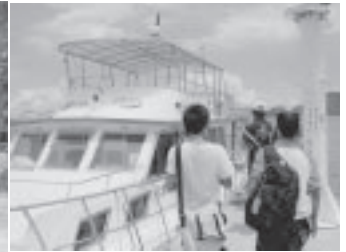
研修で乗船した船