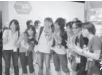
女の子はすぐに打ち解け仲良しに！