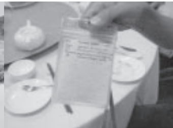
名前カードの裏にお互いのメールアドレスを交換。