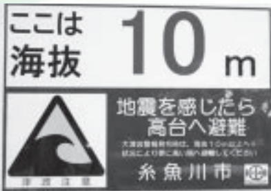
※海拔とは…海面を0mとした高さ