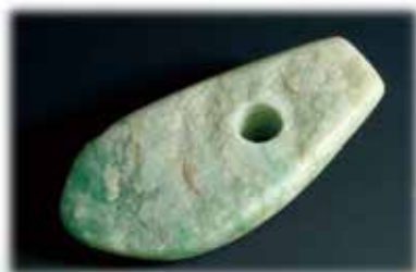
ヒスイ製大珠（長者ヶ原考古館所蔵）

最終候補となった 5 つの岩石の中から、糸魚川ゆかりの「ヒスイ」が選定されました。